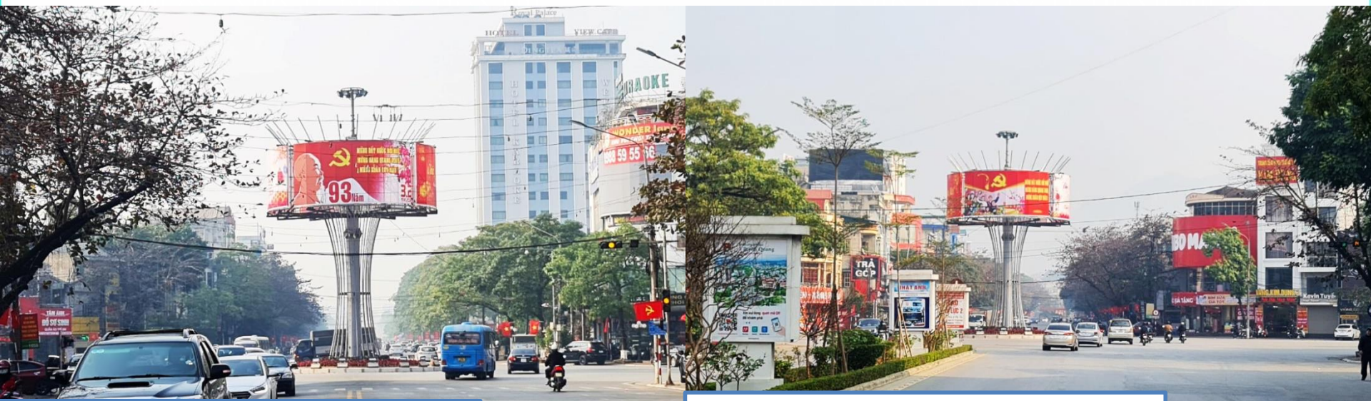
Hướng nhìn: Từ đường Bình Thuận (TTTP ra cao tốc)