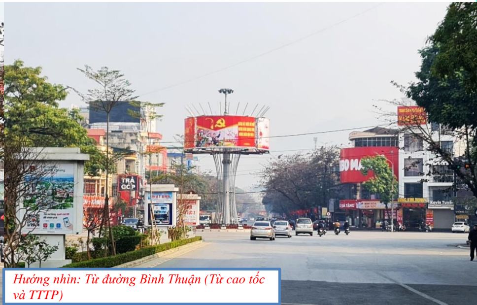
Hướng nhìn: Từ đường Bình Thuận (Từ cao tốc và TTTP)