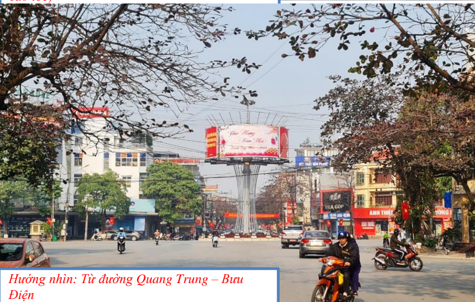
Hướng nhìn: Từ đường Quang Trung – Bưu Điện