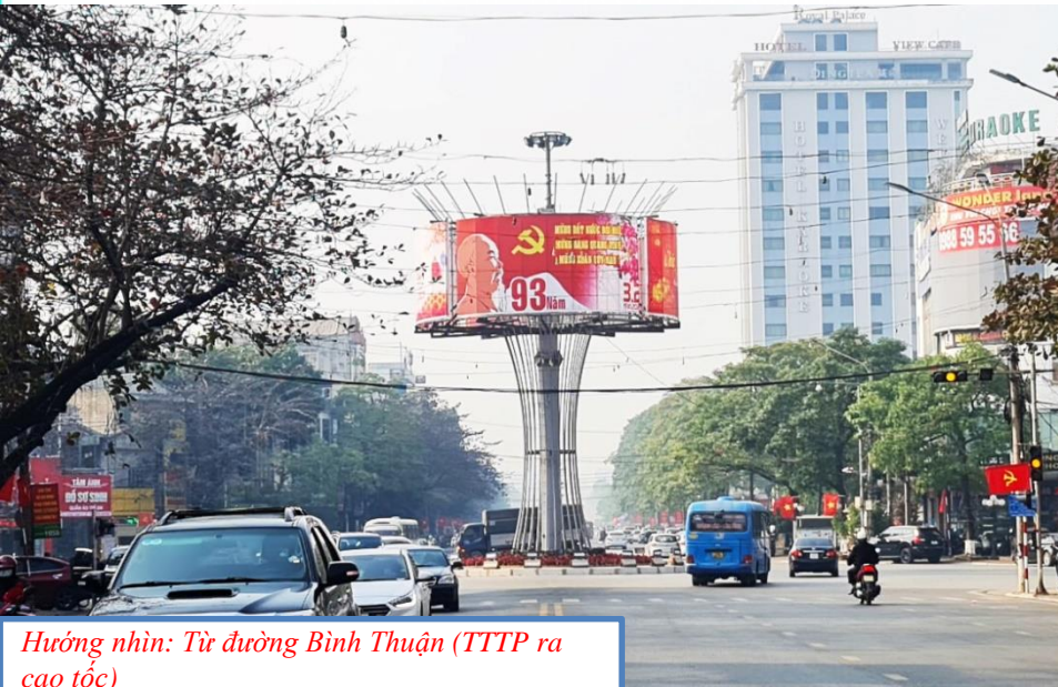
Hướng nhìn: Từ đường Bình Thuận (TTTP ra cao tốc)