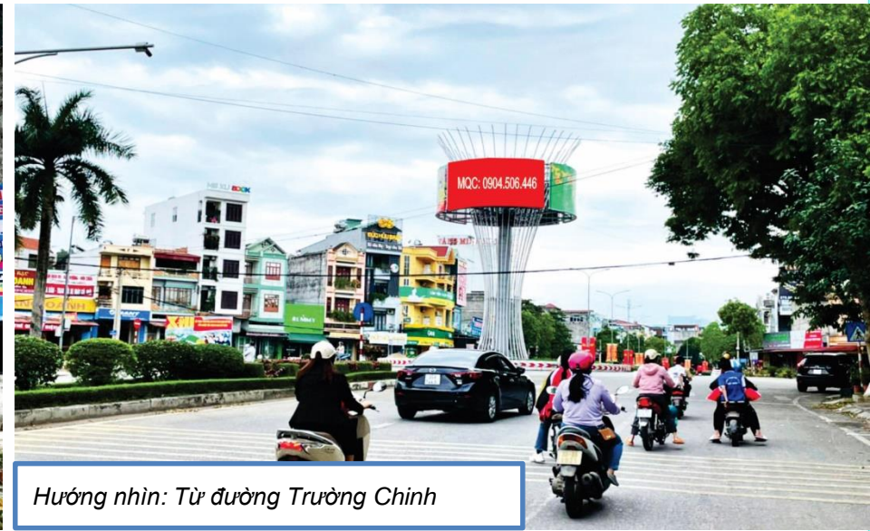
Hướng nhìn: Từ đường Trường Chinh