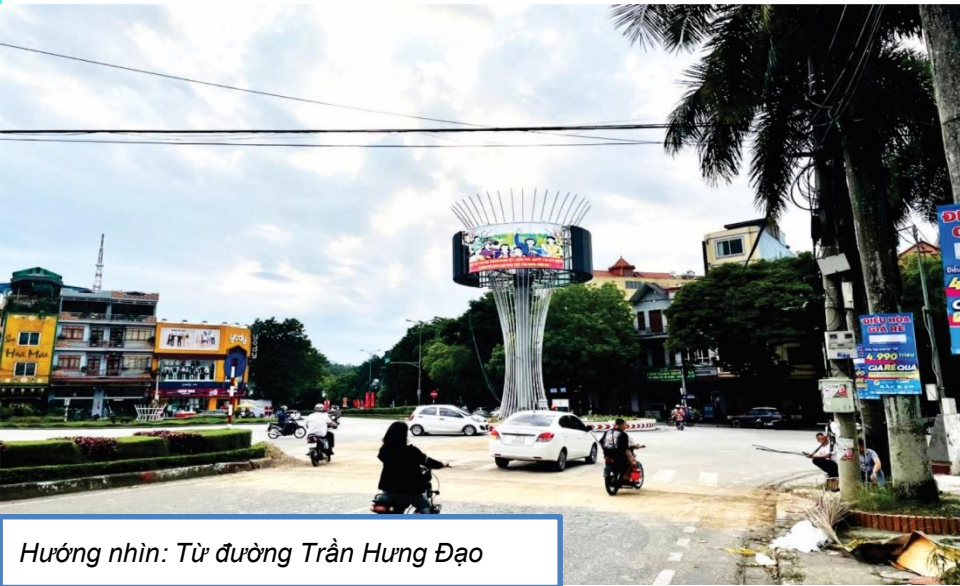
Hướng nhìn: Từ đường Trần Hưng Đạo